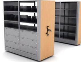
Steele Móvil® 192