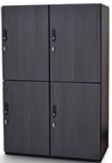
Armarios de oficina 190