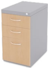
Cajoneras universales 186