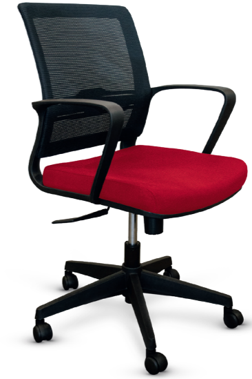
02102CV04MTGN Silla operativa