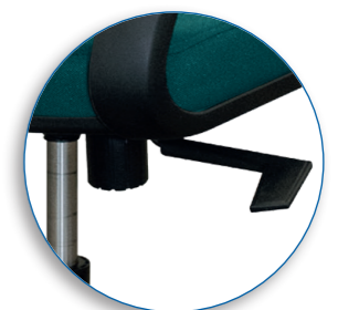
Mecanismo del asiento y respaldo se reclinan simultáneamente