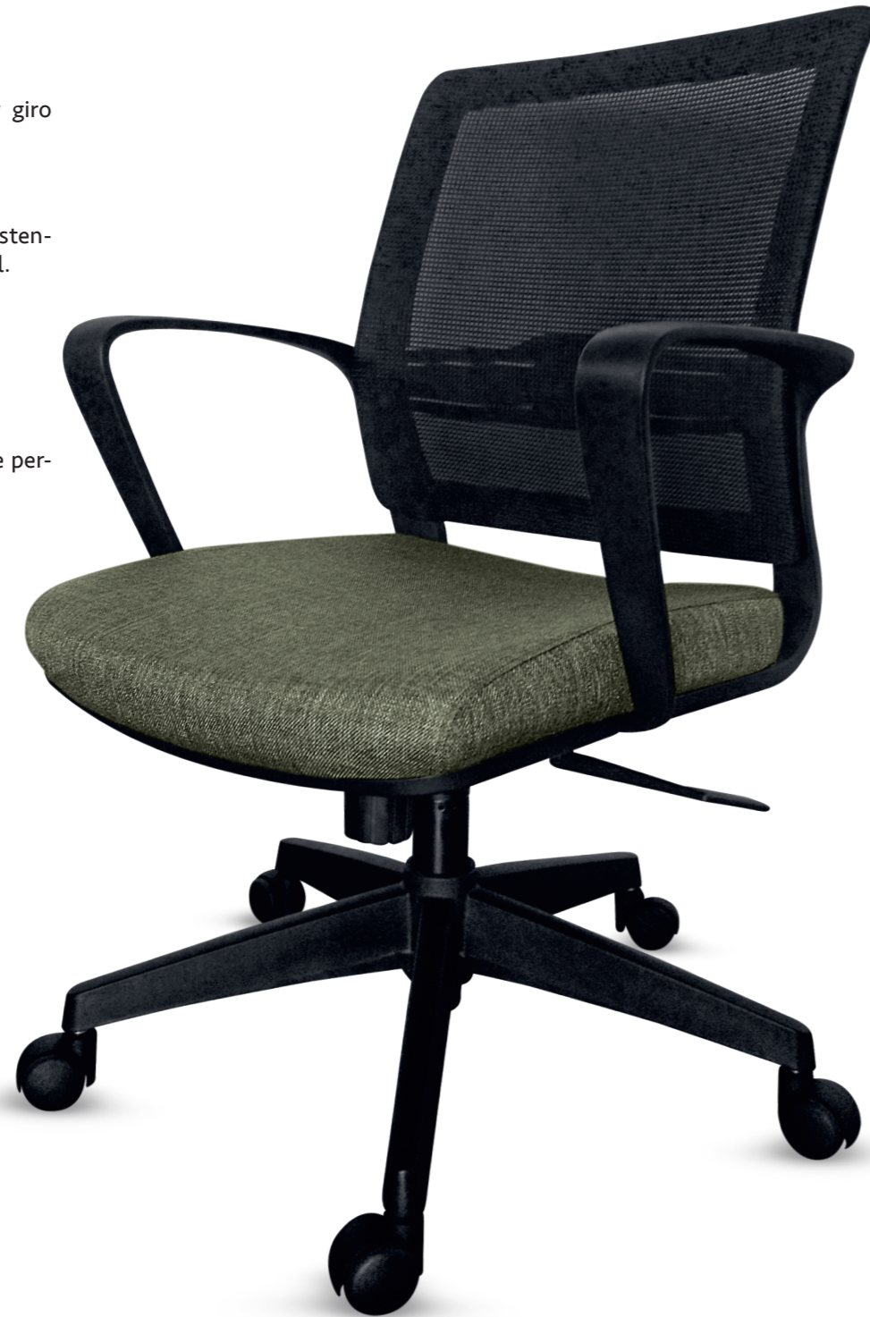
02102CV04MTGN Silla operativa

De cinco puntos con rodajas que permiten su fácil desplazamiento.